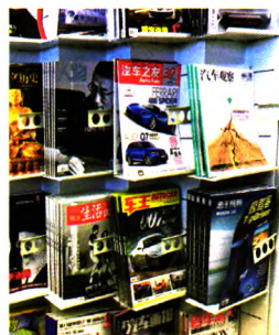
首都机场T3实景拍摄