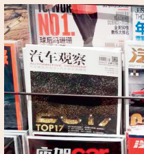
首都机场T3实景拍摄