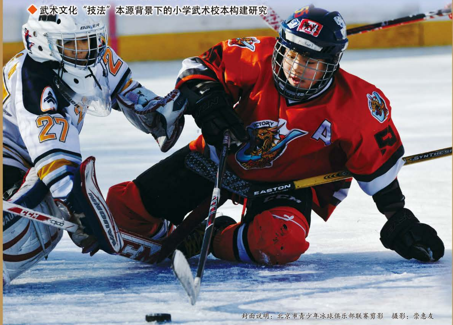
封面说明：北京市青少年冰球俱乐部联赛剪影