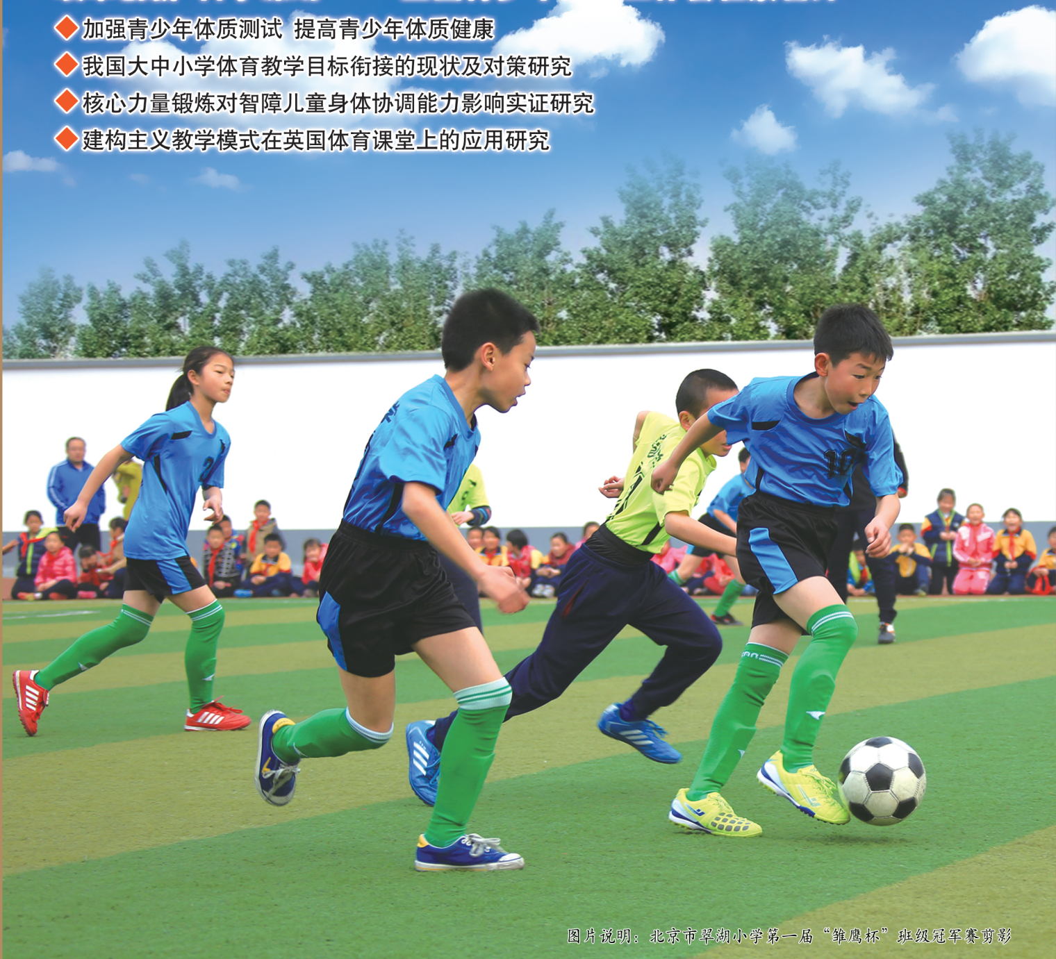
图片说明: 北京市翠湖小学第一届“雏鹰杯”班级冠军赛剪影