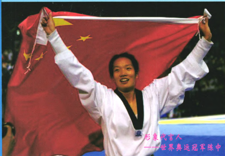
形象代言人 ——世界奥运冠军陈中