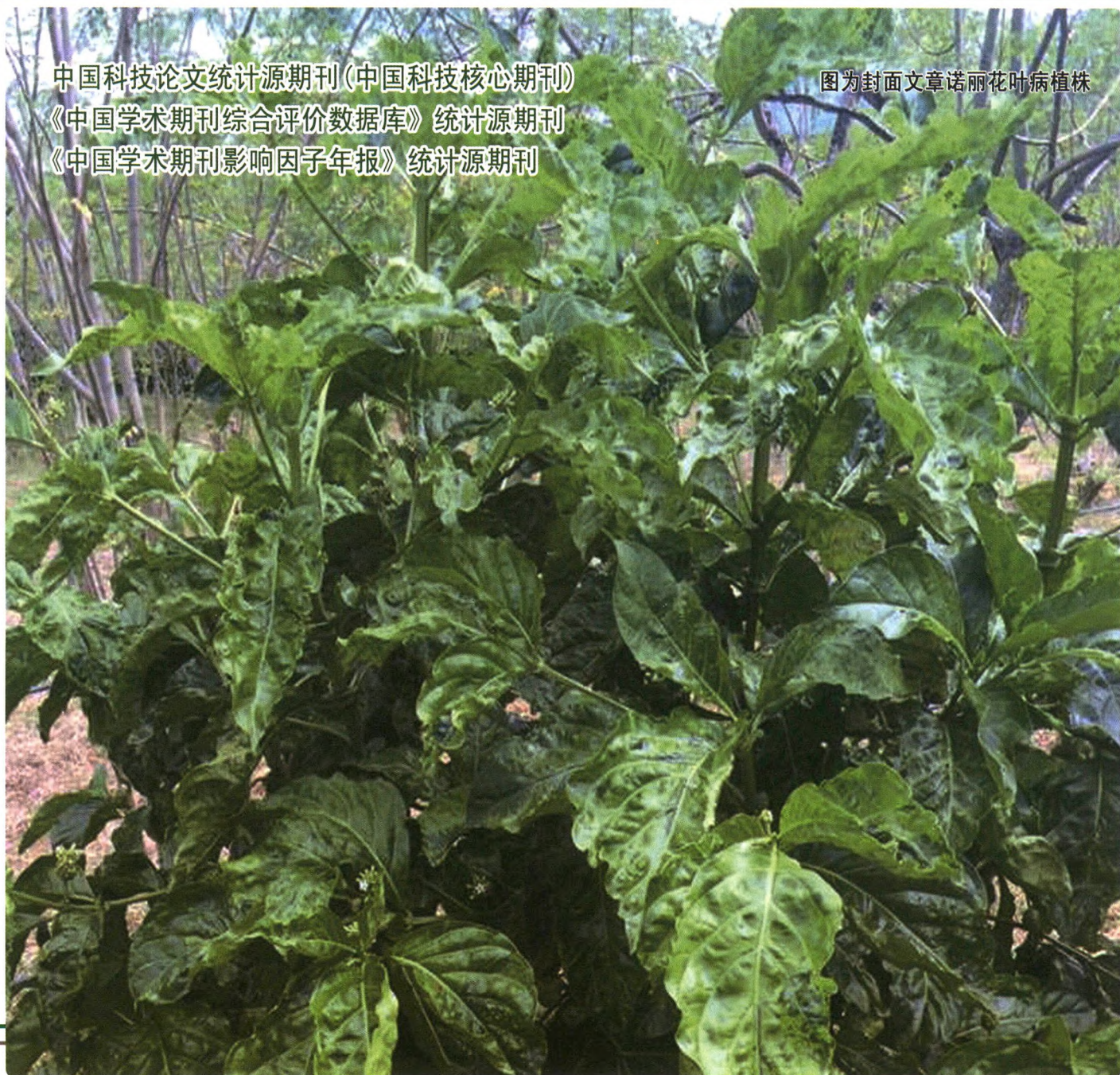
图为封面文章诺丽花叶病植株

中国科技论文统计源期刊(中国科技核心期刊) 《中国学术期刊综合评价数据库》统计源期刊 《中国学术期刊影响因子年报》统计源期刊