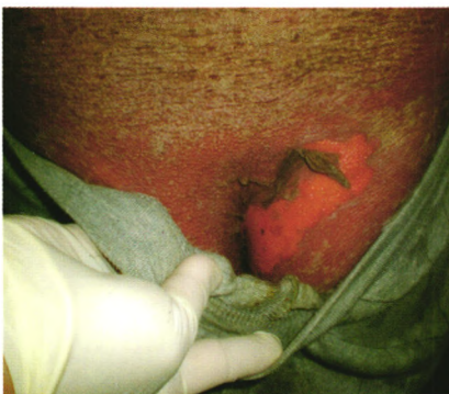
图 1 DDS 治疗 41 天(已停用 6 天)皮疹发生情况