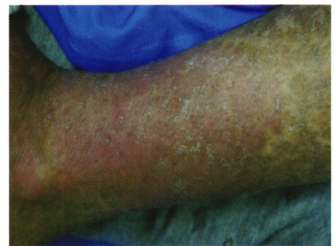
图 2 DDS 治疗 69 天(已停用 34 天)皮疹发生情况