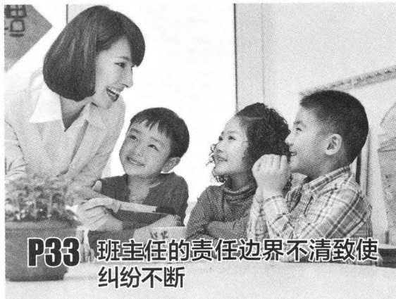
P33 班主任的责任边界不清致使纠纷不断