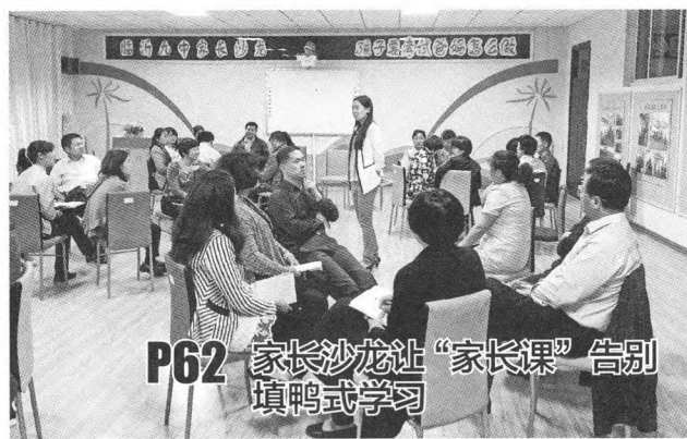
P62 家长沙龙让“家长课”告别填鸭式学习