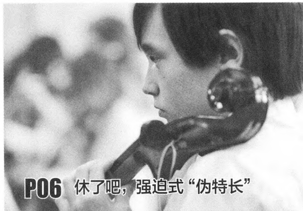
P06 休了吧，强迫式“伪特长”