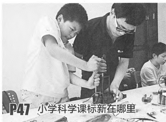
P47 小学科学课标新在哪里