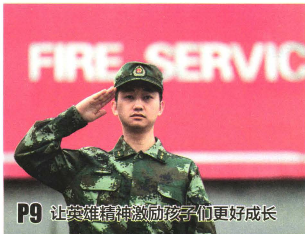
P9 让英雄精神激励孩子们更好成长