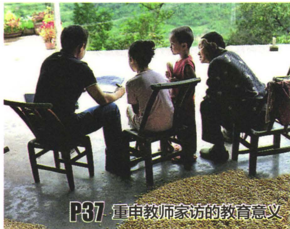
P37 重申教师家访的教育意义