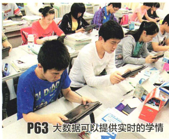
P63 大数据可以提供实时的学情