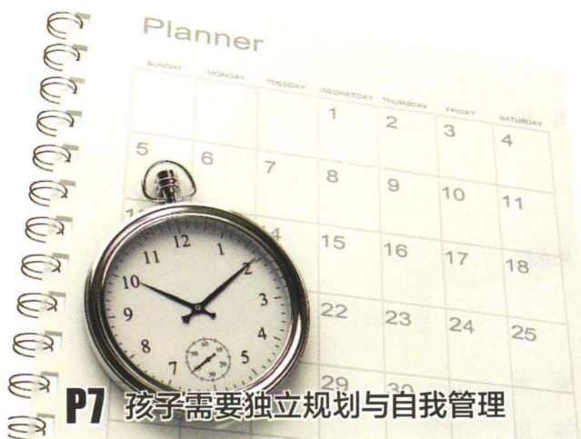
P7 孩子需要独立规划与自我管理