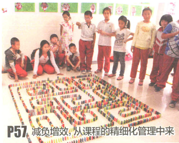
P57 减负增效,从课程的精细化管理中来