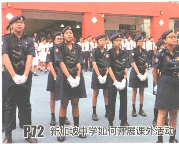
P72 新加坡中学如何开展课外活动