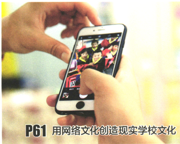
P61 用网络文化创造现实学校文化