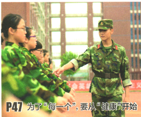
P47 为了“每一个”，要从“健康”开始