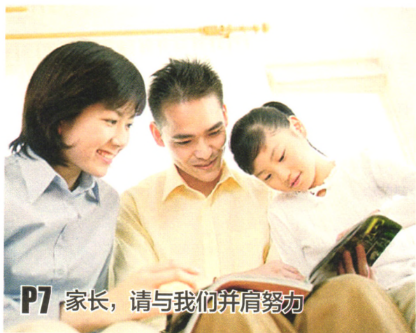
P7 家长，请与我们并肩努力