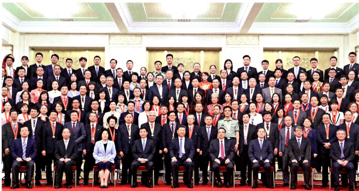
9月10日,党和国家领导人习近平、李克强、王沪宁等在北京人民大会堂会见庆祝2019年教师节暨全国教育系统先进集体和先进个人表彰大会受表彰代表。