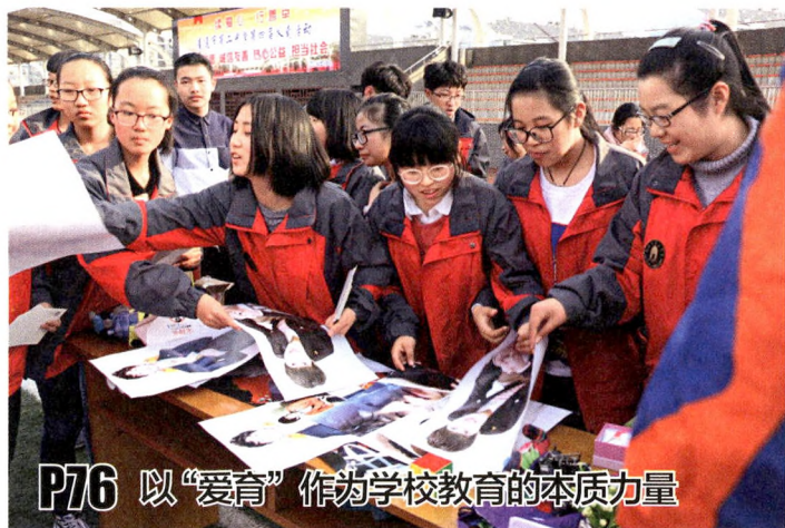
P76 以“爱育”作为学校教育的本质力量