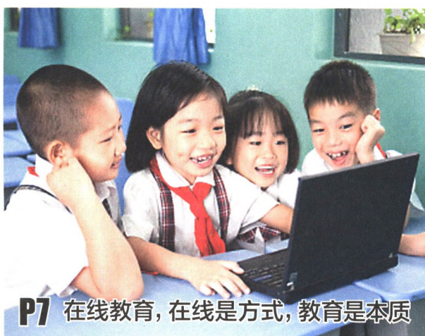
P7 在线教育，在线是方式，教育是本质