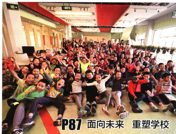
P87 面向未来 重塑学校