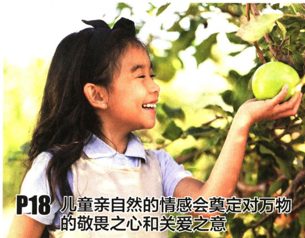
P18 儿童亲自然的情感会奠定对万物的敬畏之心和关爱之意

社会主义核心价值观落地与德育课程一体化 36 社会主义核心价值观如何融入小学教育 胡金木 40 省域中小学德育课程一体化的建构与实践 张志勇 整体育人与美育 44 清华大学附属小学：成志教育——儿童成长的指南针 窦桂梅 49 南菁高级中学：新时代发展素质教育的美学范式 杨培明 ——“以美育重构中学生活”的实践探索