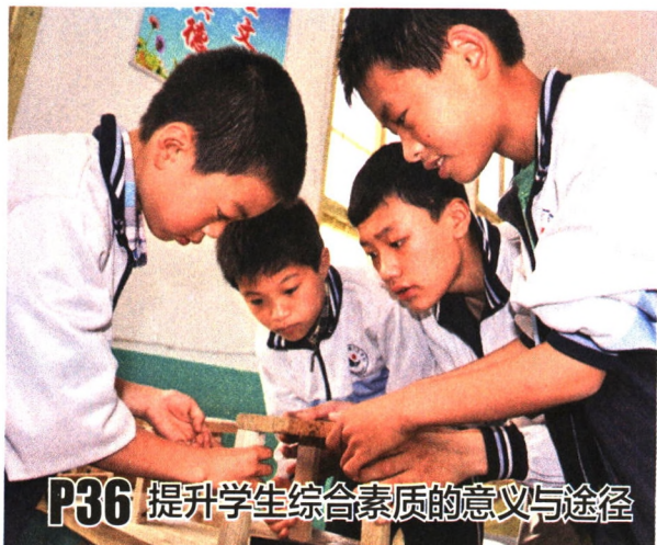
P36 提升学生综合素质的意义与途径