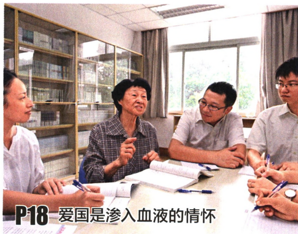
P18 爱国是渗入血液的情怀