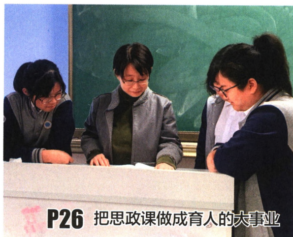
P26 把思政课做成育人的大事业