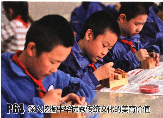
P64 深入挖掘中华优秀传统文化的美育价值