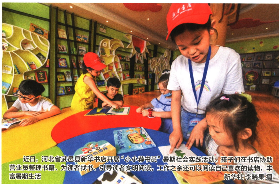
近日,河北省武邑县新华书店开展“小小荐书员”暑期社会实践活动。孩子们在书店协助营业员整理书籍、为读者找书、引导读者文明阅读,工作之余还可以阅读自己喜欢的读物,丰富暑期生活