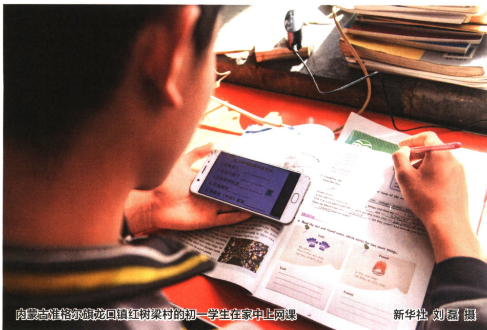
内蒙古准格尔旗龙口镇红树梁村的初一学生在家中上网课