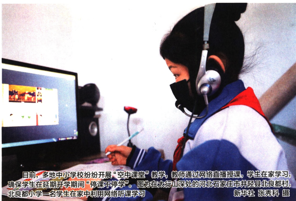
目前,多地中小学校纷纷开展“空中课堂”教学,教师通过网络直播授课,学生在家学习,确保学生在延期开学期间“停课不停学”。图为在太行山深处的河北石家庄市井陘县北良都村,北良都小学一名学生在家中利用网络听课学习