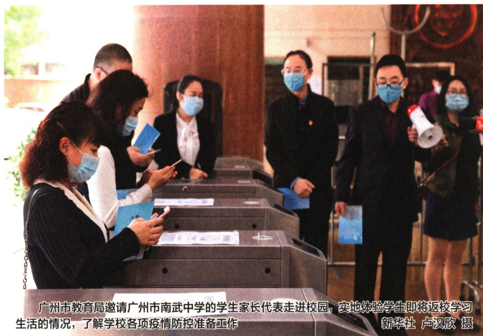
广州市教育局邀请广州市南武中学的学生家长代表走进校园，实地体验学生即将返校学习生活的情况，了解学校各项疫情防控准备工作