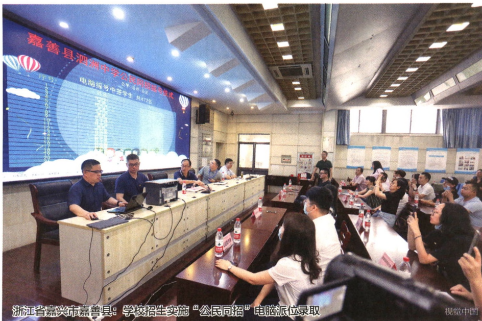
浙江省嘉兴市嘉善县：学校招生实施“公民同招”电脑派位录取