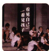
凉水井中学教育 实录电影《未来学校》