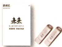
第八届中国教育 创新年会典藏特辑