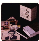
“新春的第一本书” 先锋书店联名阅读盲选