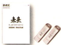
第八届中国教育 创新年会典藏特辑