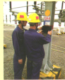
研发智能移动巡检系统