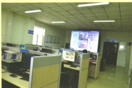
供电系统监测检测中心，实现维修数字化和信息化