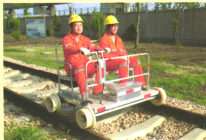
研制轨道电动巡检车，提高巡检效率