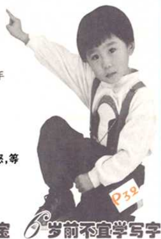
宝宝 6 岁前不宜学写字