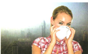
呼吸消化 P54 雾霾天更要预防呼吸道疾病