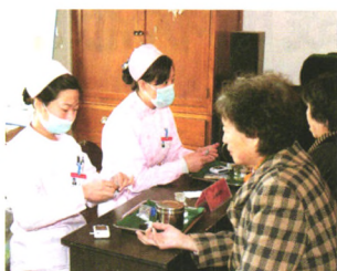
糖友天地 P52 突然发胖查查血糖