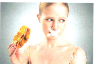
肿瘤防治 P86 吃出来的癌症