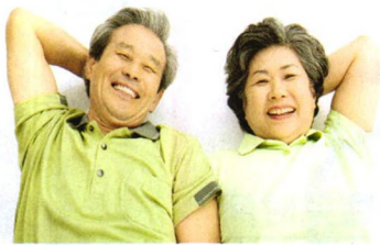
慢病防治 P65 滑膜炎,老少都会中招