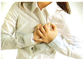
两性夜话 P70 6 种类型的乳房胀痛不是病