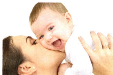
生活孕婴 P35 哄孩子的 6 个危险动作