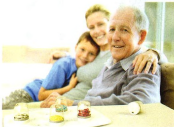
用药指南 P69 小心胃药“暗箭”伤人