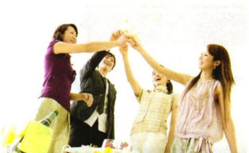
养心处方 P79 怎样纠正不合群心理