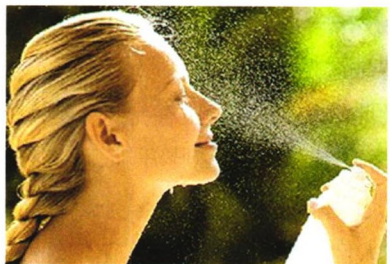
生活美容 P39 这些症状预示你该换护肤品