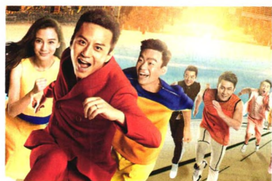
图说城事 P10 奔跑吧 兄弟