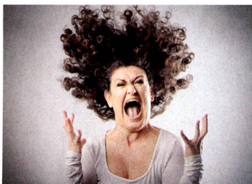
慢病防治 P64 暴脾气警惕青光眼