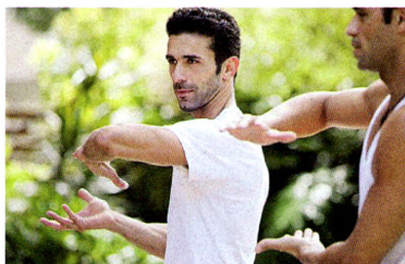
两性夜话 P72 男性想长寿 摒弃5种不良习惯