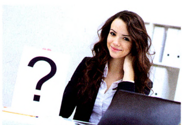
养心处方 P79 “定期忘记时间”缓解快节奏生活