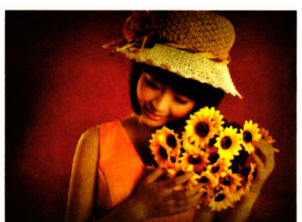
全程体验 P28 18 岁女孩漫画记录抗癌生活