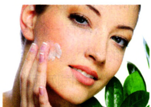
本期视点 P18 过敏困扰何时休