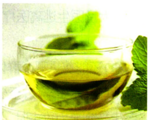
中医中药 P42 夏季喝两种茶养心安神