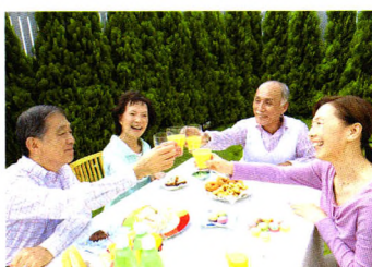
记者观察 P20 大妈吸毒：“临界”妇女的精神危机