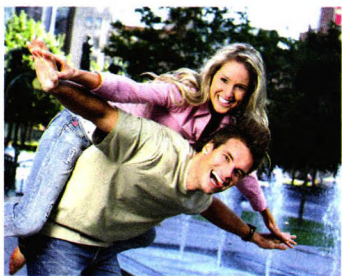
两性夜话 P72 幸福婚姻的保鲜法则