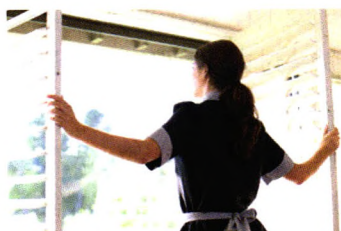
生活宝典 P37 7 个时刻最该开窗