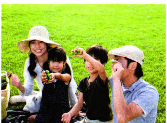
潮流美食 P92 周末踏青 带上自制完美便当