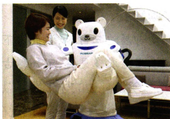
图说城事 P10 医疗机器人的治愈时代