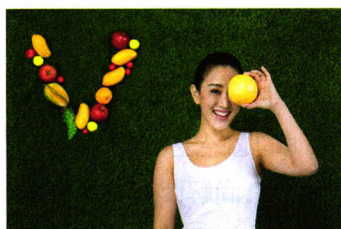
生活指南 P30 6 个方法排清全身毒素