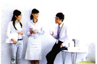
职场解惑 P82 职场新人应警惕 7 种心理