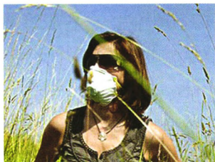
本期视点 P20 别在绝望中“喘息”