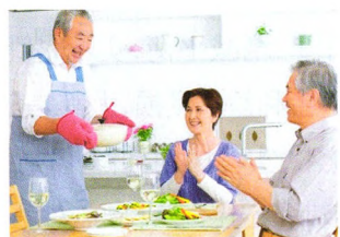
长寿宝典 P37 老人贫血要调整饮食戒浓茶