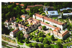
名院访问 P22 走进古老的德国海德堡大学综合医院