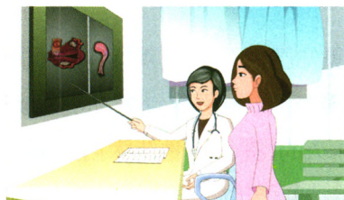
慢病防治 P65 9 种癌前病变要警惕