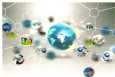
健康热词 P22 跨境医疗