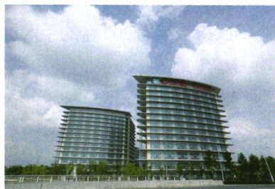
健康军营 P41 肝胆相照 光耀东方