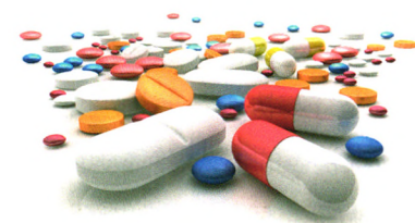
合理用药 P68 服此类药物别忘了护肠