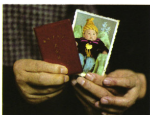
声音传递 P22 无处安放的余生