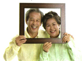
长寿宝典 P44 年纪大了 7 个动作要慢一点