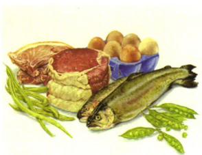
食疗定制 P86 秋高气爽“贴秋膘”