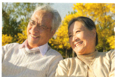
本期视点 P24 胃 你准备好了吗