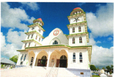
潮流旅游 P88 是时候出发去度蜜月了