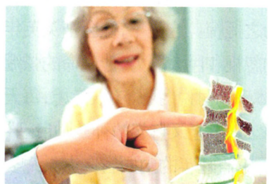
慢病防治 P64 预防骨质疏松越早越好