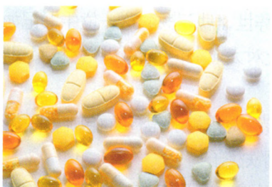
合理用药 P69 药片为什么有大有小