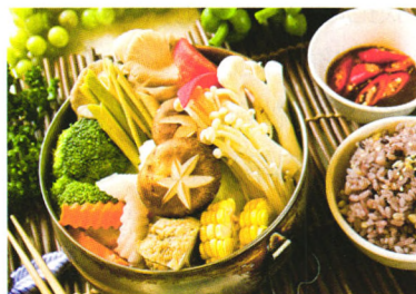
潮流美食 P92 冬日锅物