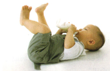
生活孕婴 P37 冬季小儿腹泻又来袭