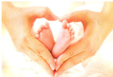
记者观察 P24 呵护早到的天使