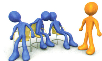
慢病防治 P65 糖尿病 OR 低血糖?