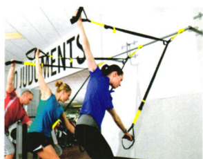
记者观察 P18 莫让“私教”偷走健康