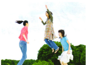
第一时间 P36 抓住春季新陈代谢好时机