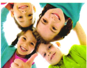
妇幼保健 P66 还给孩子们清新的口气