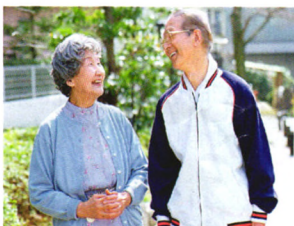
长寿宝典 P40 老年人的心血管“四首歌”