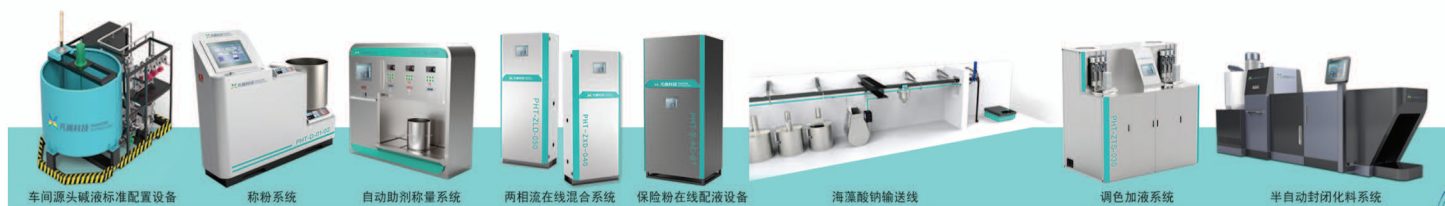
车间源头碱液标准配置设备