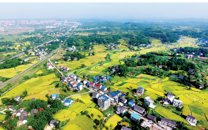
P12 实施乡村振兴战略 勾勒乡村美丽画卷