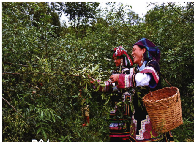
P64 金融活水润民心 索玛花开日子红