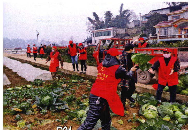
P31 建强党组织 打赢疫情防控阻击战