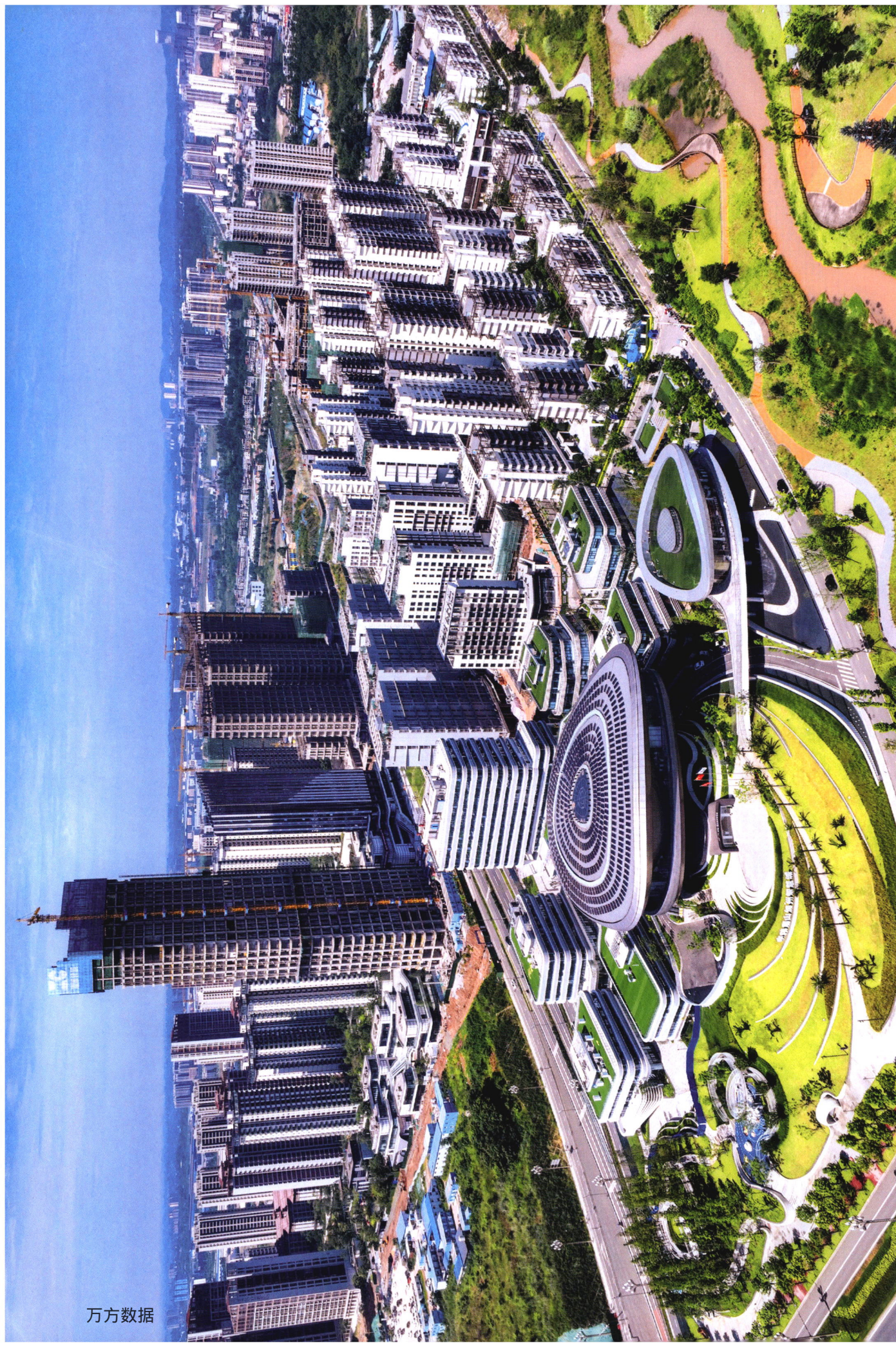
眉山天府新区核心区。