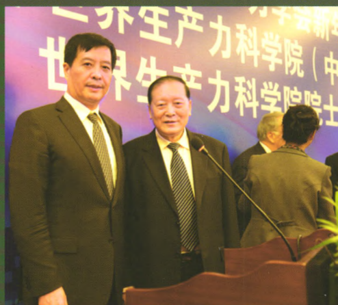
中国生产力学会秘书长陈胜昌 院士与新晋院士侯光明合影

编辑、出版/生产力研究杂志社 山西省太原市水西关街26号(邮编:030002) 电话/0351-4070868 0351-4063743(兼传真) 刊名题字/赵如琳 排版/本刊信息资料室 印刷/山西同方知网印刷有限公司 英文翻译/段桂珍 国内总发行/太原市报刊发行局 国外总发行/中国国际图书贸易总公司