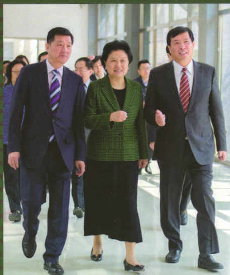
2015年3月26日国务院副总理 刘延东视察北京电影学院