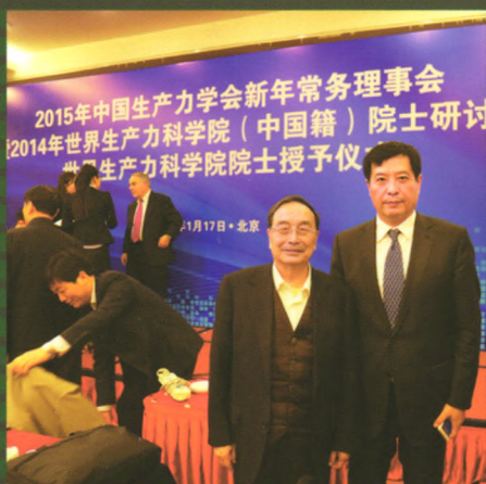
全国人大常委会副委员长蒋正华 与新晋院士侯光明合影