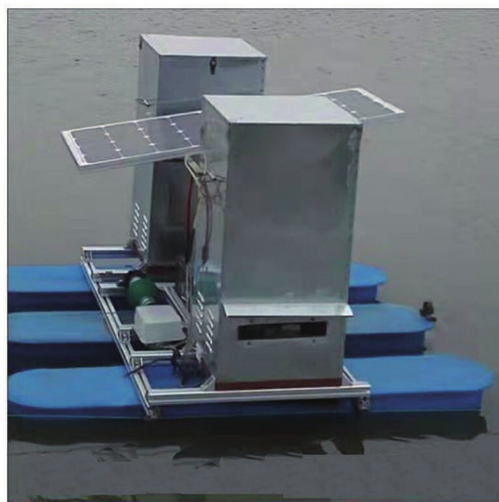
行走式水产养殖自动投饵机