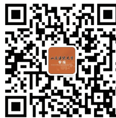
山东建筑大学学报 微信公众号二维码

中国高校优秀科技期刊 SCD《科学引文数据库》收录期刊 RCCSE 中国核心学术期刊 《中国核心期刊(遴选)数据库》收录期刊 《中国学术期刊(光盘版)》全文收录期刊 《万方数据—数字化期刊群》全文入网期刊 《中国学术期刊综合评价数据库》数据来源期刊 《中文科技期刊数据库》(维普)收录期刊 中国科技论文统计源期刊 超星数字期刊数据库收录期刊 《全国报刊索引》源期刊 华东地区优秀期刊 山东省优秀期刊