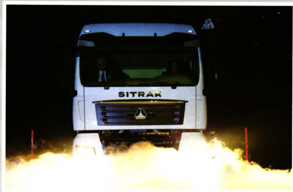
中国重汽与德国曼公司强强合作 SITRAK品牌正式启动 首辆重卡隆重下线