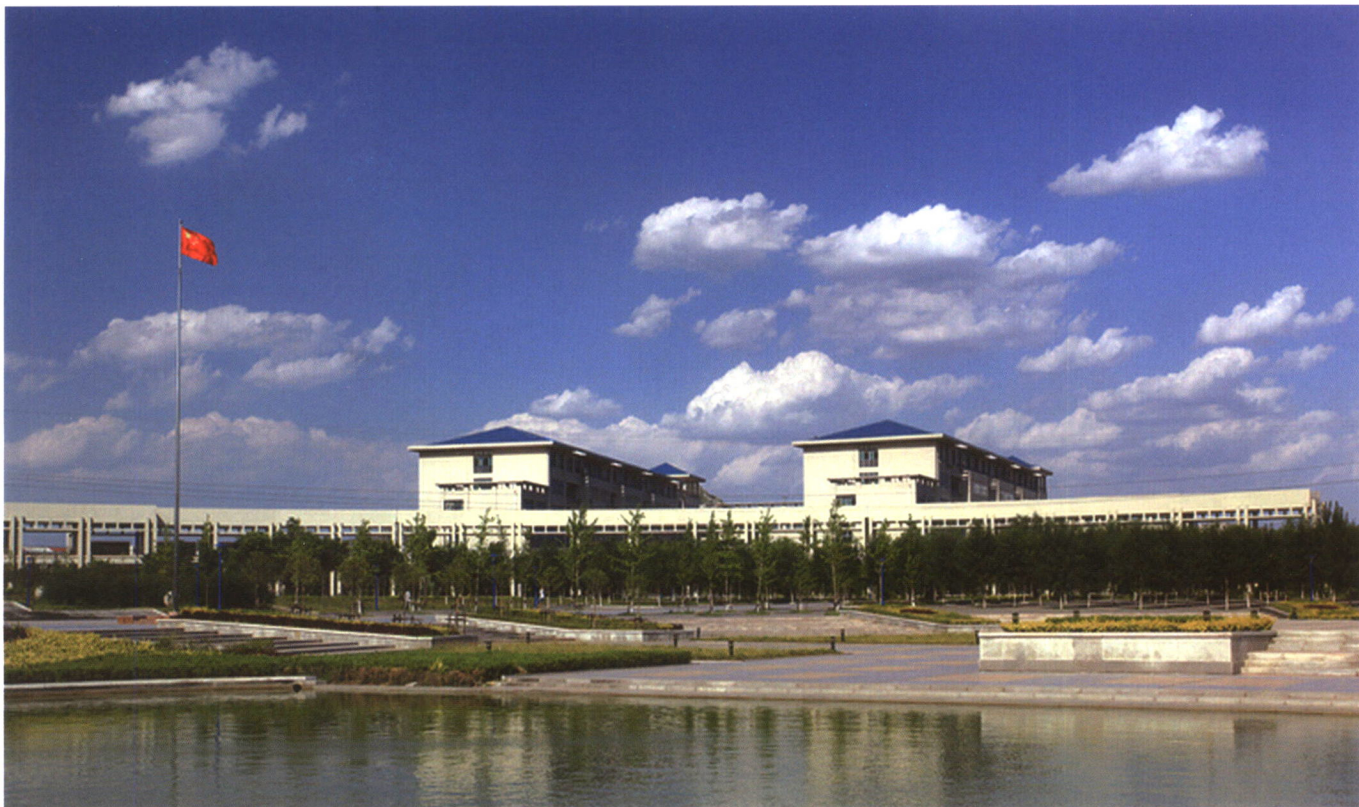
山东中医药大学校园文化长廊

JOURNAL OF SHANDONG UNIVERSITY OF TRADITIONAL CHINESE MEDICINE