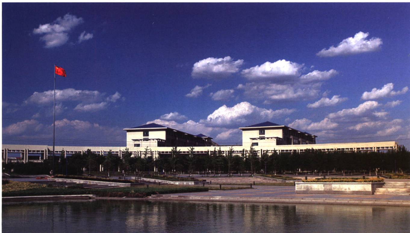
山东中医药大学校园文化长廊

JOURNAL OF SHANDONG UNIVERSITY OF TRADITIONAL CHINESE MEDICINE