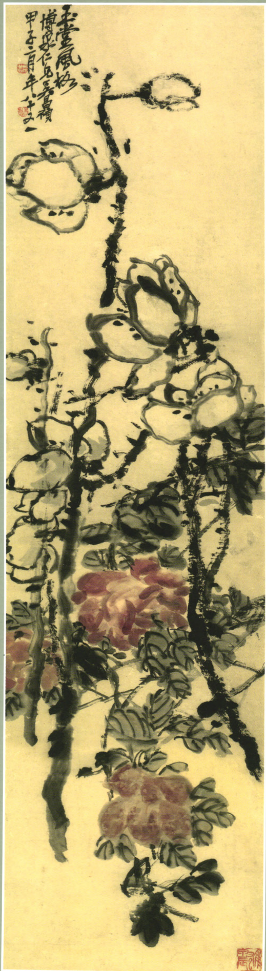
清 吴昌硕 玉堂风格图 纸本设色 138.8cm×33.8cm 中国国家博物馆藏

国内统一刊号：CN34-1299/J 国际标准刊号：ISSN1673-6109 邮发代号：26-95 定价：国内28元 境外10美元