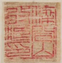
南宋 张即之 华严经残卷之一 纸本册页 18.2cm × 11cm 安徽博物院藏