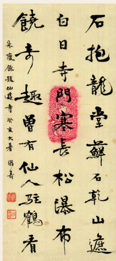
PAGE 17 游寿 朱庆余诗