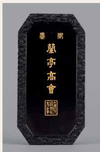
PAGE 7 乾隆御制“兰亭高会”墨