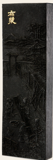
PAGE 8 江南织造增崇进贡“棉花图·布浆诗”墨