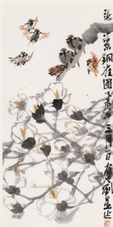
PAGE 37 刘星 鸟语花薰梦里香