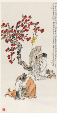
PAGE 22 赵俊生 东坡诗意